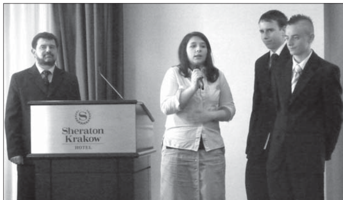
Laureaci konkursu przedstawiają swój nagrodzony projekt podczas Wielkiej Gali Samorządności w hotelu Sheraton

Pierwsze spotkanie z przedszkolakami miało miejsce 28 października ubiegłego roku. Grupa zebrała się w szkole już o 8.00, by móc przebrać się i przećwiczyć swe role. Uczniowie wychodzący do dzieci są przebrani i ucharakteryzowani na postaci z ulubionych bajek podopiecznych „Chatki Puchatka”. W „Dniu Animacji”, bo tak właśnie nazywało się to spotkanie, gimnazjaliści przedstawili dzieciom trzy fragmenty bajek z przesłaniem, a były to: „Czerwony Kapturek”, „Chory Kotek” i „Kubuś Puchatek w norze”. Dzięki temu został przeprowadzony konkurs „Zgaduj, zgadula - jaka bajula?”. Po konkursie i nagrodach dla dzieci, które wręczył Czerwony Kapturek wraz z Tygrysiem i Prosiaczkiem, przeszedł czas